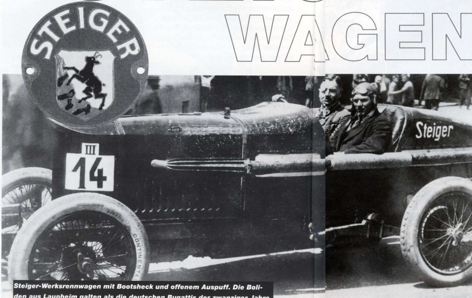
Steiger-Werksrennwagen mit Bootsheck und offenem Auspuff. Die Boliden aus Laupheim galten als die deutschen Bugattis der zwanziger Jahre.