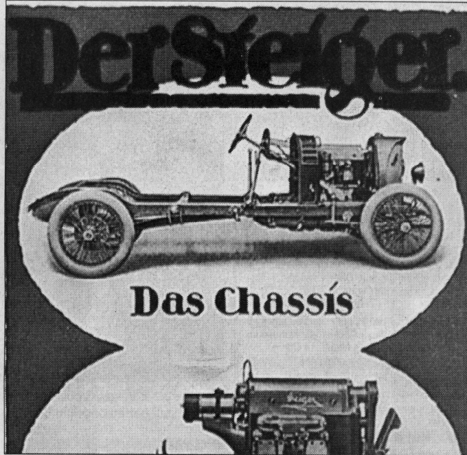
Aus Michael Schicks Buch: Ein Prospekt des Autoherstellers Steiger.

Neun Jahre lang hat sich Schick mit der ehemaligen Automobilfabrik in Burgrieden beschäftigt, Quellen erschlossen und Kontakte innerhalb und außerhalb der Oldtimerzene geknüpft – bis nach Monaco und Riga. Als hilfreich erwiesen sich